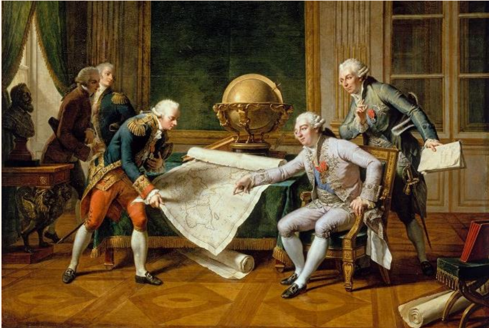
Nicolas André Monsiau, Louis XVI donnant ses instructions à La Pérouse , 29 juin 1785, 1817, château de Versailles..